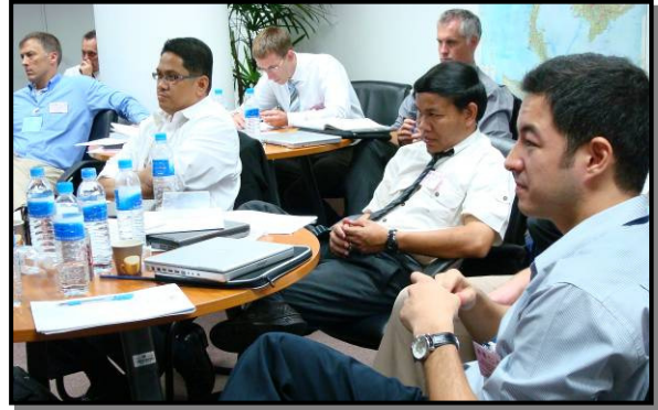
红队成员（来自亚洲地区反贩运人口项目、PeunPa 基金、英国警察机关、UNIAP、美国司法部）起草战略计划（左），认真的与会者（右）。